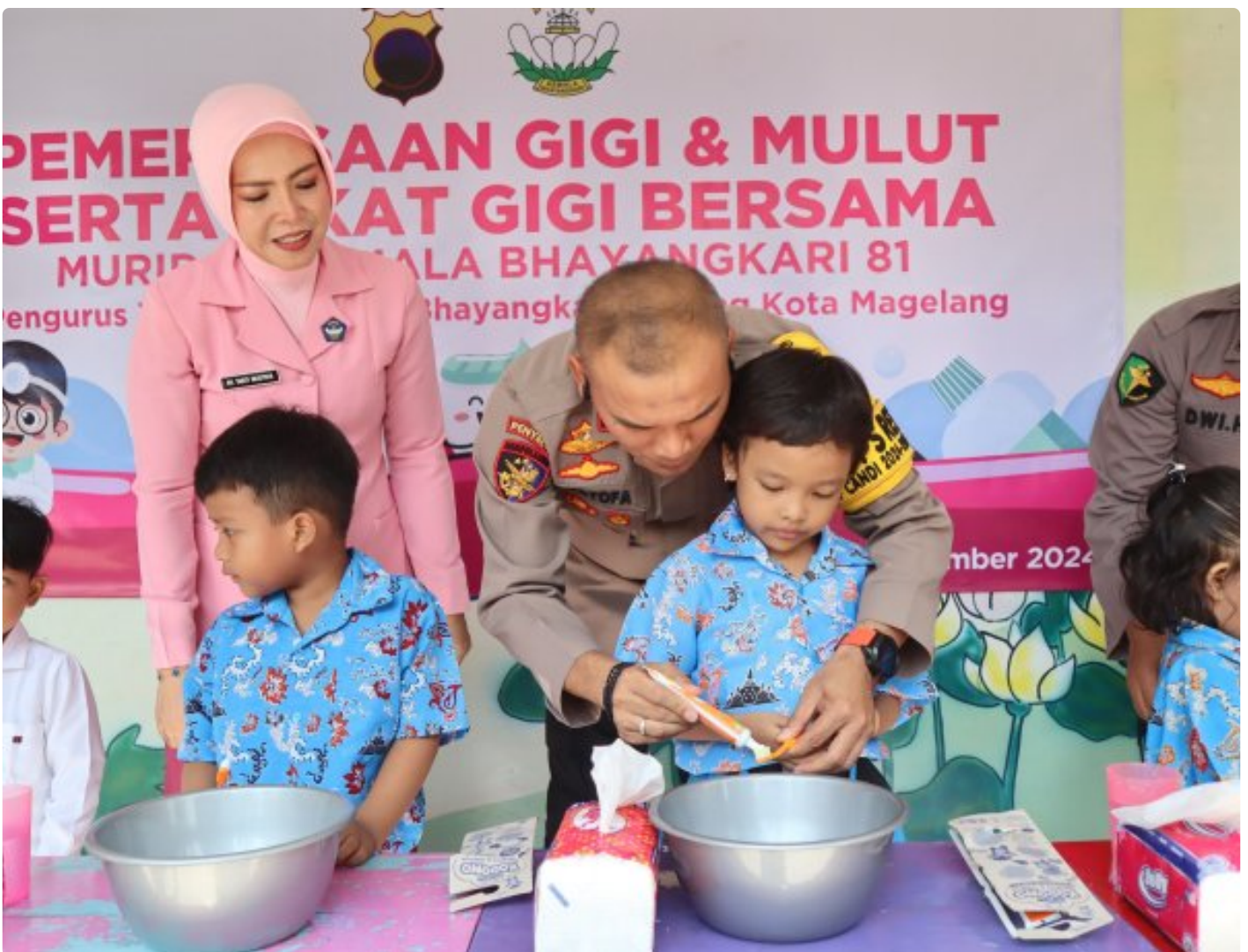
Foto: Bhayangkari Cabang Kota Magelang kembali menunjukkan kepeduliannya terhadap kesehatan anak-anak dengan menggelar Sosialisasi Kesehatan Gigi dan Mulut di TK Kemala Bhayangkari 81 Magelang, Selasa (5/11/2024).

Magelang- Bhayangkari Cabang Kota Magelang kembali menunjukkan kepeduliannya terhadap kesehatan anak-anak dengan menggelar Sosialisasi